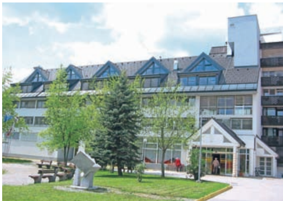
Služba pomoči na domu v občini Železniki je od leta 2015 organizirana v okviru Centra slepih, slabovidnih in starejših Škofja Loka.

Največkrat se občani in njihovi svojci za storitev socialne oskrbe na domu zanimajo, ko se pojavijo spremembe zara-