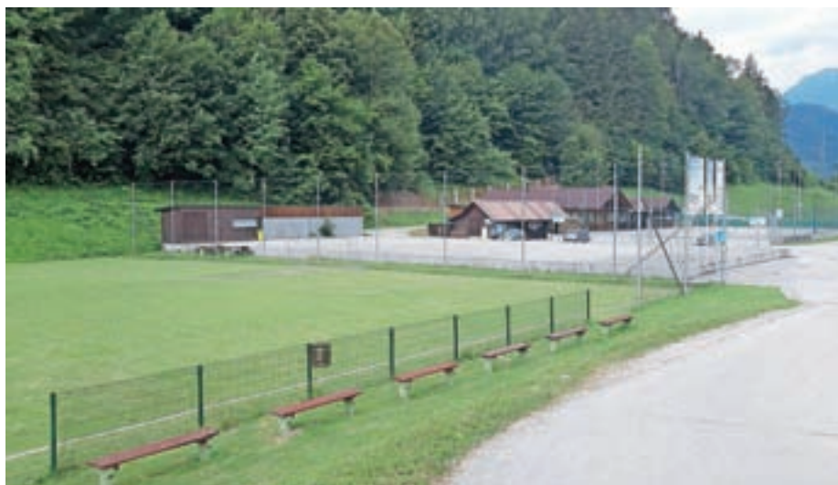
Športni park Rovn bomo skušali še bolj približati občanom.

Športno srečanje podjetij Selške doline od leta 2000 naprej, ko se ekipe podjetij pomerijo v devetih disciplinah, vedno postreže z zanimivimi dvoboji, velik poudarek je na druženju rekreativcev. Košarkarski (pred šolo Selca) in kasneje turnirji v ulični košarki so bili zelo dobro obiskani, sploh v prvih dvajsetih letih delovanja. V teh časih je bila med najaktivnejšimi zimska sekcija, predvsem alpsko smučanje. ŠD Selca je bilo