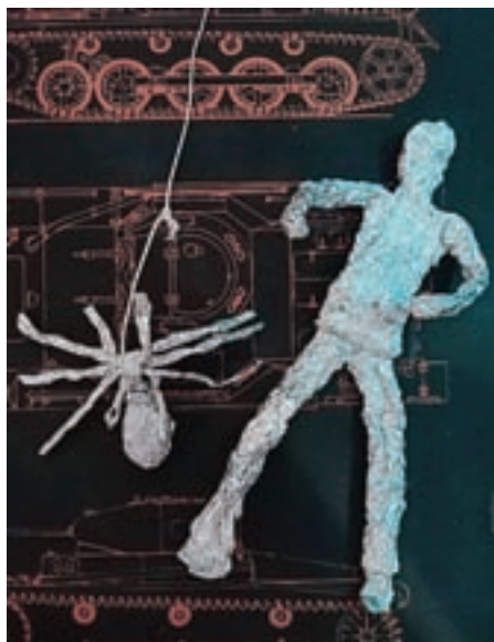
Jasna Tukić, 4. b