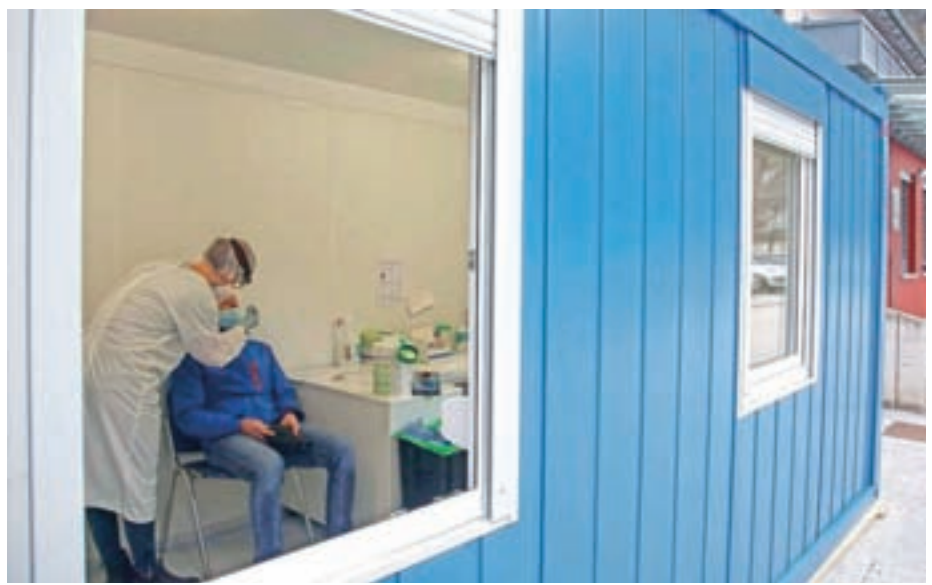
Testiranje s hitrimi antigenskimi testi v kontejnerju pred zdravstvenim domom na Racovniku