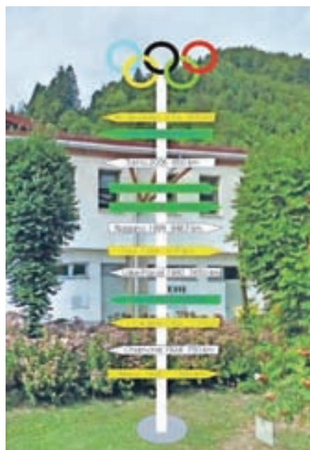
Primer olimpijskega smerokaza

Januarja smo izvedeli, da smo bili uspešni pri prijavi projekta Interaktivno sodobno, ki smo ga kot vodilni partner prijaviteli na razpis LAS loškega pogorja. Partnerji v projektu so še Občina Žiri, Muzejsko društvo Žiri in Razvojna agencija Sora. Vsebinska, ki se ji bomo posvetili, je organizirana športna dejavnost v Selški dolini po drugi svetovni vojni. Načrtujemo stalno muzejsko razstavo, ki bo na ogled v avli Športne dvorane Železniki. Predstavljeni bodo športna društva in klubi, ki spodbujajo športni način življenja in ustvarjajo uspešne zgodbe. Predmeti, vezani na te športne zgodbe, bodo svoje mesto našli v večji vitrini. Poseben poudarek v projektu bo zbiranje fotografij in priprava fototeke, ki bo na ogled na digitalnih