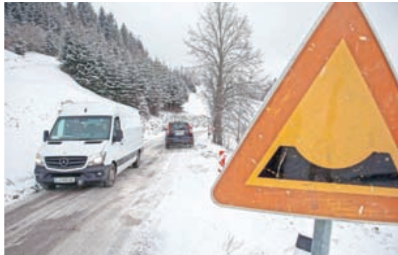
Plaz na regionalni cesti blizu Lajš naj bi začeli sanirati v prvi polovici letošnjega leta.

Glede obnove vozišča od Rotka proti Soriški planini nameravajo v drugi polovici letošnjega leta objaviti razpis za izvajalca gradbenih del, obnovo pa načrtujejo prihodnje leto. Predvidena je preplastitev vozišča v celotni širini in skupni dolžini 2,8 kilometra. Ocenjena vrednost gradbenih del znaša 1,8 milijona evrov. Pojasnili so tudi, da je projekt rekonstrukcije ceste od prvega križišča regionalnih cest nad vasjo Sorica do konca vasi Sorica na seznamu projektov, ki je sestavni del gradiva, ki bo v tem mesecu pripravljeno kot predlog vladi za uvrstitev v dr-