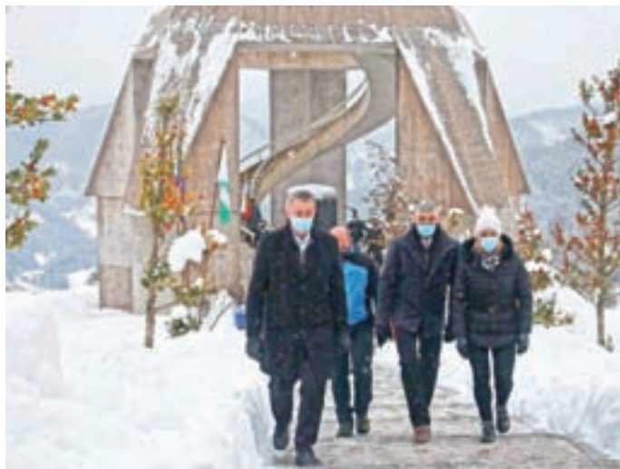
Žrtvam dražgoške bitke sta se poklonili tudi delegaciji Občine Železniki in Krajevne skupnosti Dražgoše - Rudno.