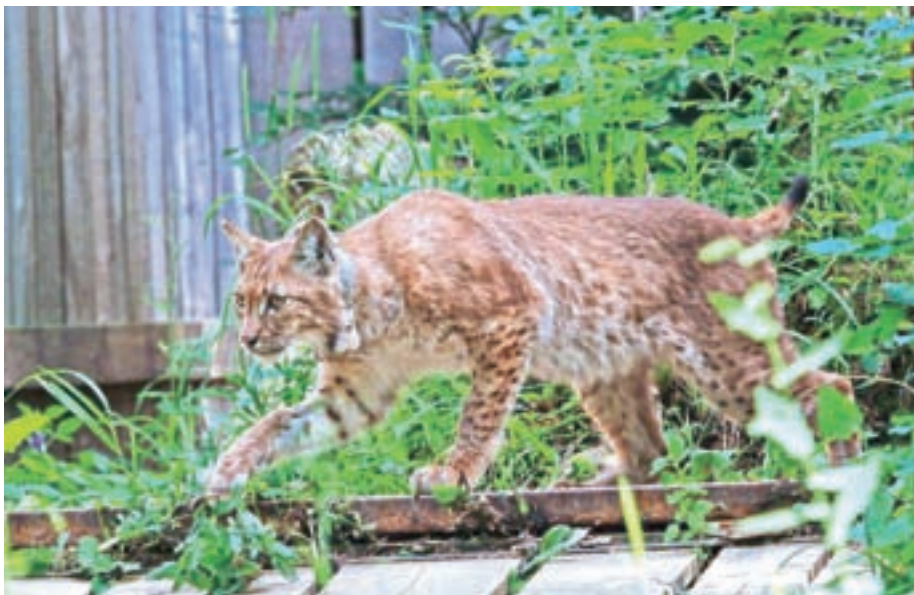
Ris Maks ob izpustu iz prilagoditvene obore

Tudi tokrat si je izbral zanimivo pot, in sicer kar okrog Bohinjskega jezera. Podatki Maksovega gibanja za zdaj ne nakazujejo na to, da bi se že ustalil in si ustvaril teritorij.