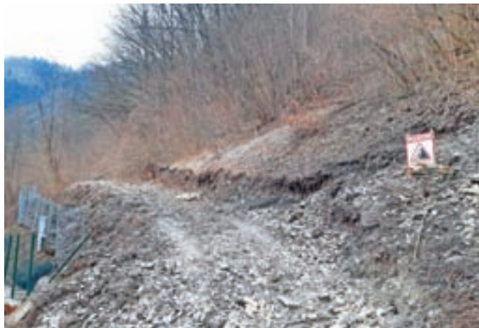
Sanacija brežine nad naseljem Na plavžu že poteka.

Občina Železniki se je že lotila ene največjih letošnjih investicij: prvega dela sanacije brežine nad naseljem Na plavžu. Zahtevno sanacijo pobočja, kjer prihaja do rednega proženja kamnitega materiala, zadnji večji podor pa je bil januarja lani, bo izvedlo podjetje Eho Projekt s partnerjema Miha Doles, s. p., in podjetjem Kaskader ter podizvajalcem Fenix+. Izvajalci že gradijo dostopno pot do območja sanacije, postavili so tudi že osnovne zaščitne mreže, ki bodo služile za čas gradnje. V prvi fazi načrtovane celovite zaščite Gorenjega konca pred padajočimi skalami so predvideli zaščito območja med objekti Na plavžu 1–77 s podajno-lovilnimi sistemi v skupni dolžini več kot štiristo metrov. Investicijo, vredno 657 tisoč evrov (z DDV), bo s 533 tisoč evri sofinanciralo okoljsko ministrstvo, ostalo pa bo prispevala občina. Po pogodbi z ministrstvom mora biti sanacija izvedena do konca letošnjega septembra.