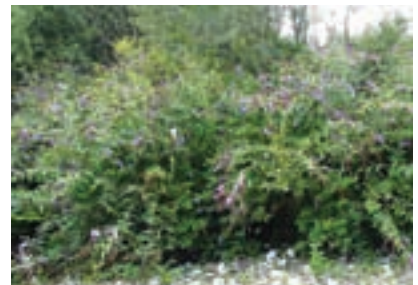
Davidova budleja – metuljnik je »tempirana bomba«.