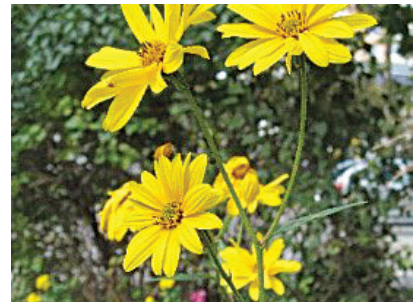
Tudi topinambur je invaziven.