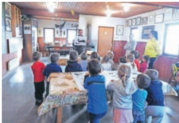
Otroci iz vrtca v Selcih na obisku v našem lovskem domu

Večino prihodkov ustvari družina s prodajo mesa divjadi, ki ga deloma odkupi pogodbeni partner Nimrod, d. o. o., deloma pa člani lovske družine. Drugi večji vir prihodka so članarine naših članov. V z divjadjo bogatem lovišču LD Selca je prisotna srnjad, jelenjad, gamsi, mufloni, divji prašiči in mala divjad; šakal, lisica, kune, poljski zajec, raca mlakarica, siva vrana, šoja in sraka.