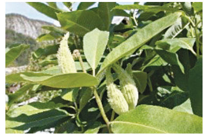
Papagajčki – sirska svilnica je na seznamu prepovedanih rastlin EU.

Prijave in dodatne informacije: jaka.subic@lu-skofjaloka.si. ali 04/506 13 60