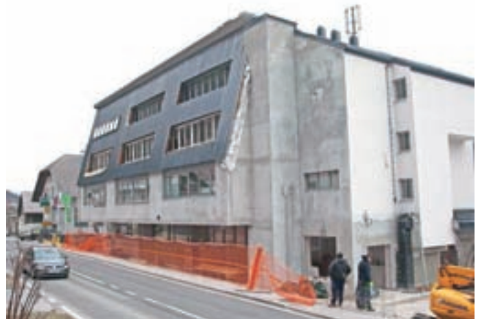
Poslovna stavba na Češnjici dobiva novo podobo.

Na poslovni stavbi na Češnjici 48 že od jeseni poteka obsežna energetska prenova, ki se je s skupnimi moči lotilo vseh pet solastnikov, med katerimi sta največja podjetje Lotrič Meroslovje in Občina Železniki. V prvi fazi so se osredotočili na obnovo strehe ter izdelavo fasade, vhoda v objekt in jaška za dvigalo. Kot so pojasnili v Lotrič Meroslovju, ta čas potekajo zaključna dela na fasadi (končni sloj fasade na severni in zahodni strani) ter vgradnja oken in vrat na vhodu. "Glede na neugodne vremenske pogoje oz. mráz je izvajanje omenjenih del oteženo. Zato smo že začeli drugo fazo, ki vsebuje ureditev stopnišča, namestitve naprave dvigala in ureditev okolice: menjavo ograje, sanacijo podpornega zidu in asfaltiranje." Asfaltiranje načrtujejo ob odprtju asfaltnih baz – okoli 20. marca. Naročili so tudi že dvigalo, vgradnjo predvidevajo čez mesec dni. "Stopnišče bo oblečeno v marmor, ki je prav tako že naročen. Polaganje naj bi bilo končano v drugem tednu marca," so napovedali v Lotrič Meroslovju. Tudi drugo fazo obnove izvaja podjetje GPS Grad iz Škofljice. Dela naj bi končal do 1. aprila, ko bodo v Lotrič Meroslovju praznovali 30-letnico.