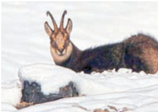
Gams v snegu

Še vedno sta v lovišču prisotni zaščiteni gozdni kuri divji petelin in gozdni jereb, a se zaradi obsežne sečnje, gradnje gozdnih cest in vlak, vznemirjanja s strani uporabnikov prostora (gobarji, izletniki ...) njun življenjski prostor manjša in verjetno jima bomo kmalu pomahali v slovo.