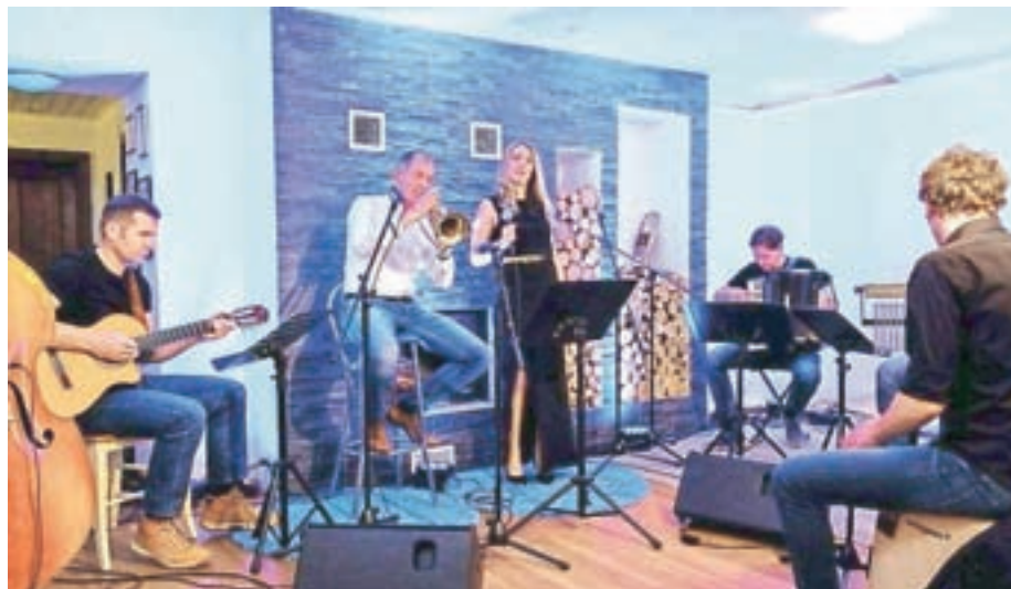
Utrinek s snemanja Valentina v mehurčku

V raznolikem tri četrt ure dolgem programu smo slišali slovenske popevke, italijanske kancone, dalmatinske pesmi, pa tudi evergreene v venčku najbolj znanih Paula Anke. Očarali so tako vrhunski solistični pevski nastopi Anto-