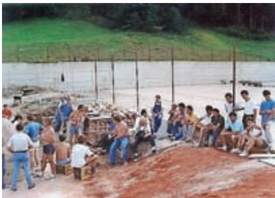
Gradnja teniškega igrišča leta 1993

Od leta 2015 dalje pa so organizirani Sre- dini prijetni popoldnevi na Rovnu (Lo- trič, d. o. o.), ki privabijo številne otroke