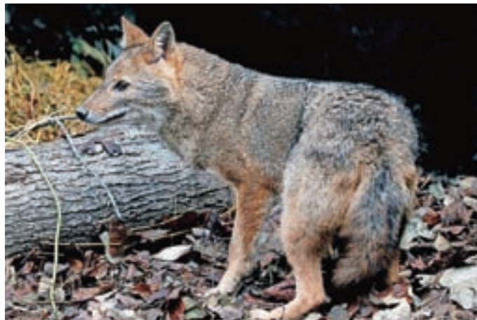
Zlati šakal – prišlek v naših gozdovih

V okviru LD Selca na podlagi Zakona o društvih in Pravil LD Selca delujejo naslednji organi: občni zbor, upravni odbor, nadzorni odbor, disciplinska komisija, komisija za kadre, komisija za ocenjevanje škod po divjadi in druge komisije, odbori in referenti na najrazličnejših področjih (kinologija, strelstvo ...). LD Selca razpolaga z dvema pomembnima objektoma: lovskim domom v Selcih, kjer so sprejemnica divjačine, hladilnica, skladišče, dvorana za sestanke in klubski prostor, ter lovsko kočo na Rastovki na Jelovici s spalnimi prostori, ku-